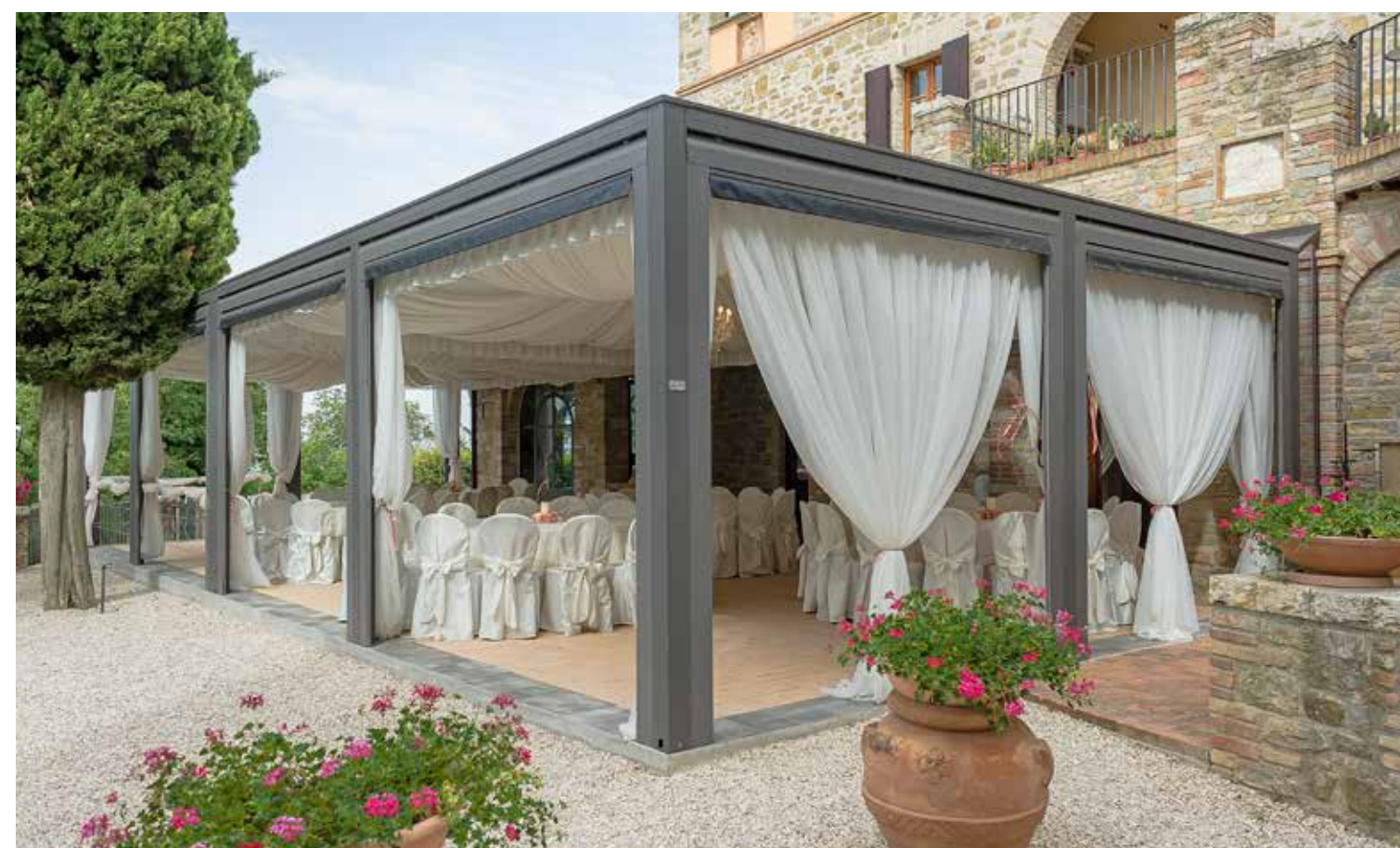
Predisposizione per tendaggi interni