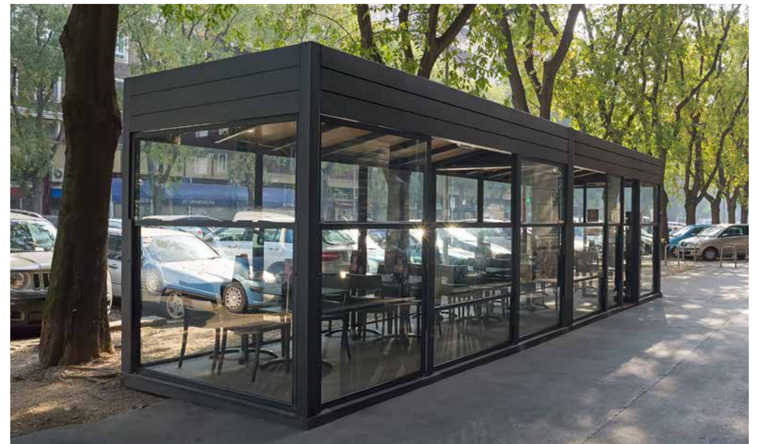
Pedana e predisposizione paraventi