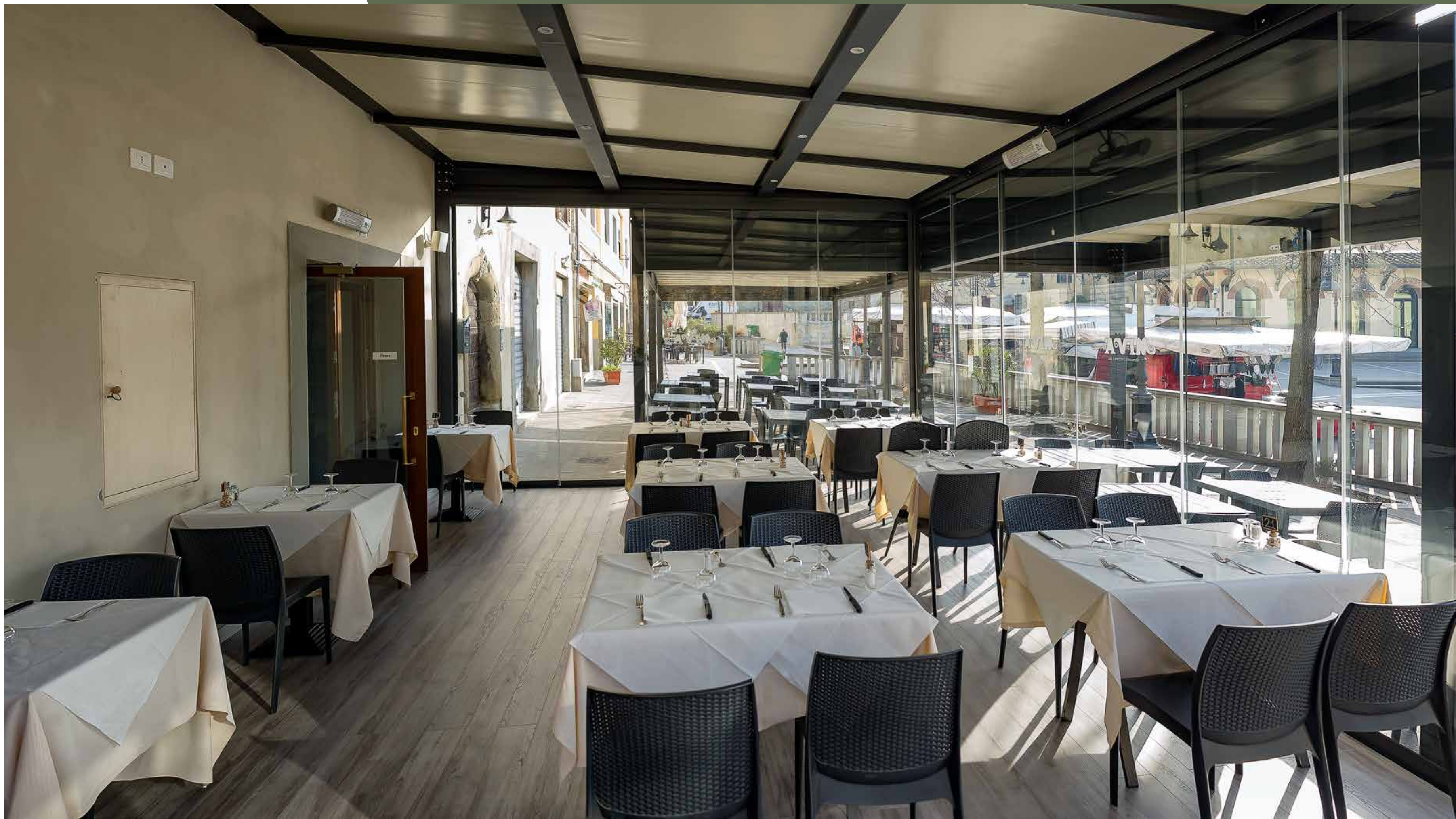
Pedana su misura per listoni - Carter per inserimento punti luce