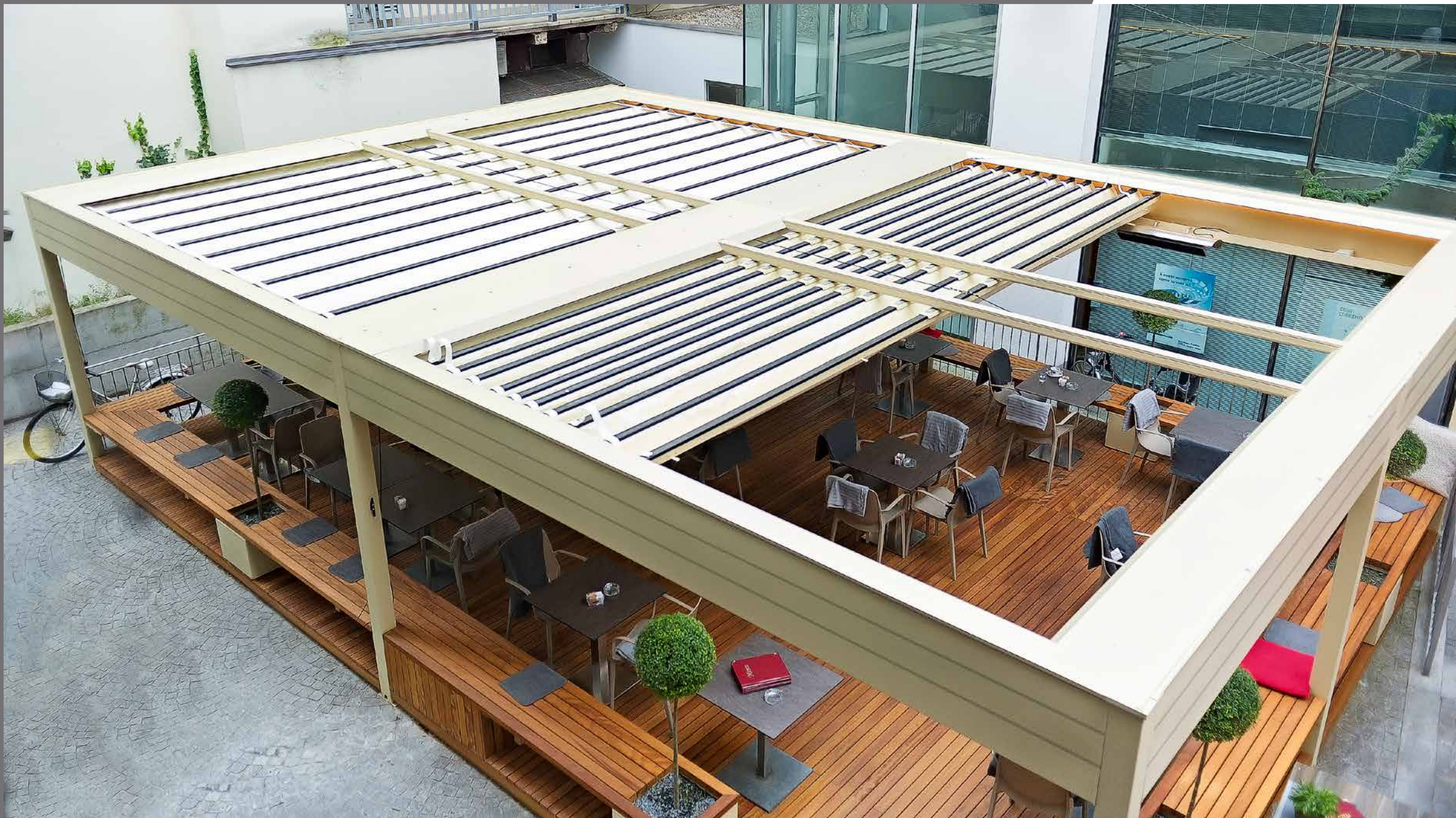
Progetto speciale con complementi