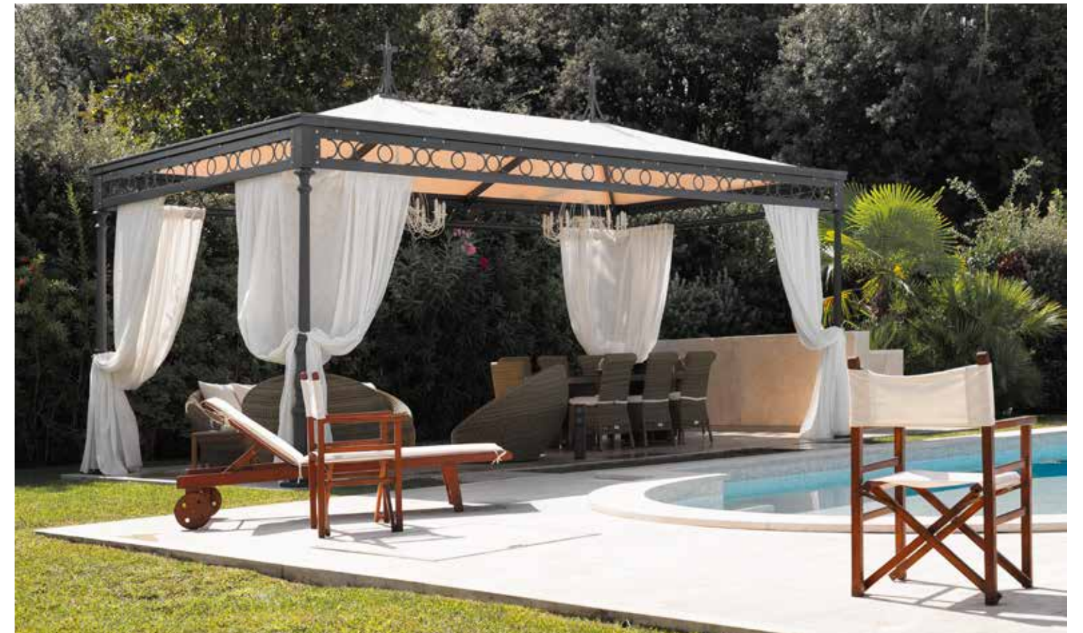
Montante rotondo a richiesta

Canale raccolta acqua Possibile predisposizione per vetri o tende avvolgibili Personalizzazione decoro trave e accessori