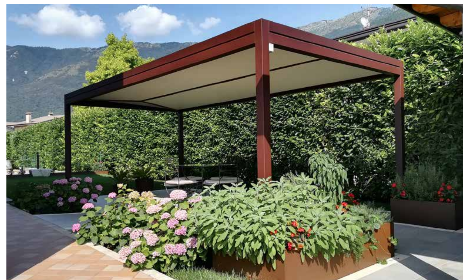
Telo di copertura con doppia pendenza