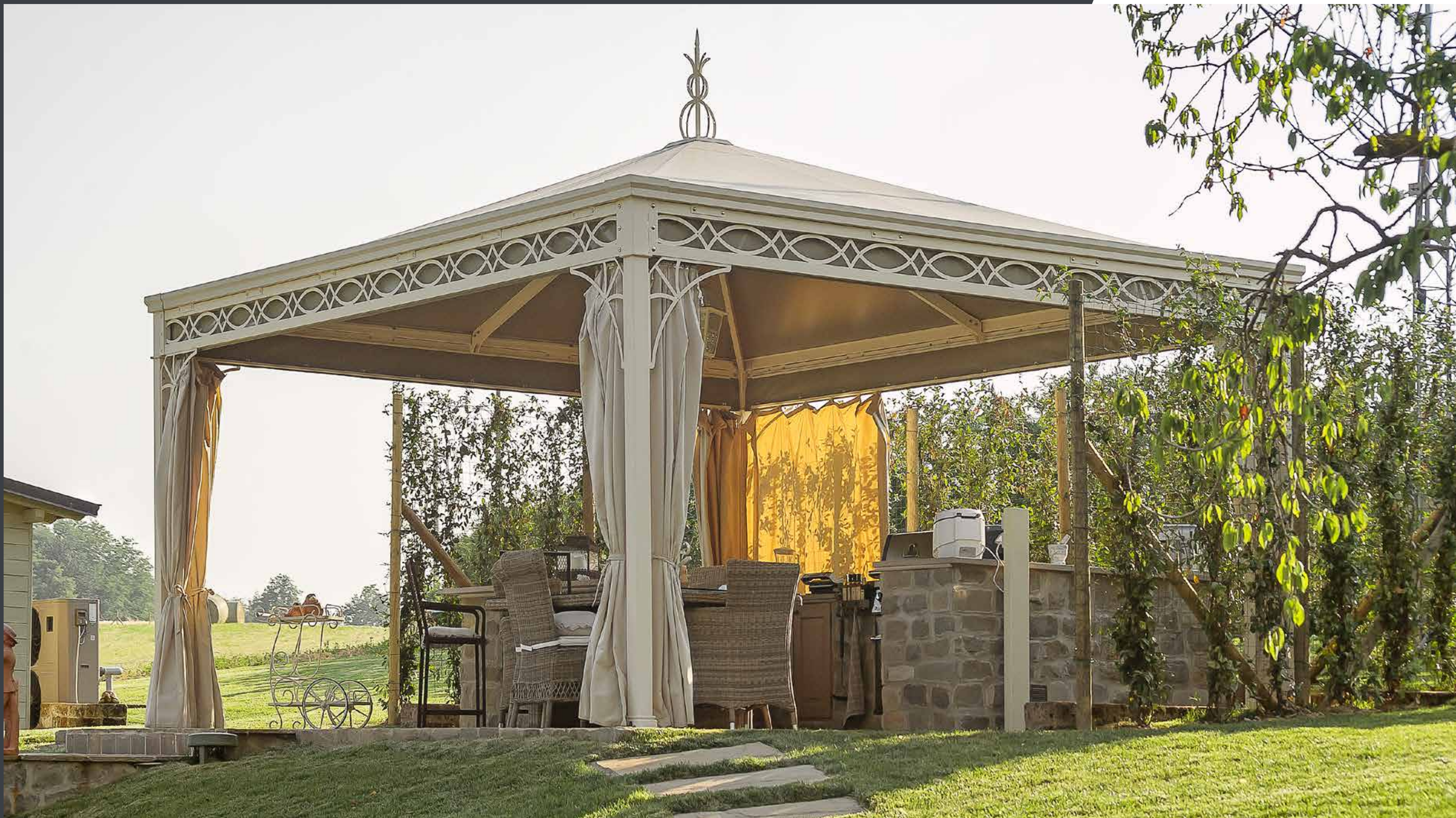
Copripalo in tessuto