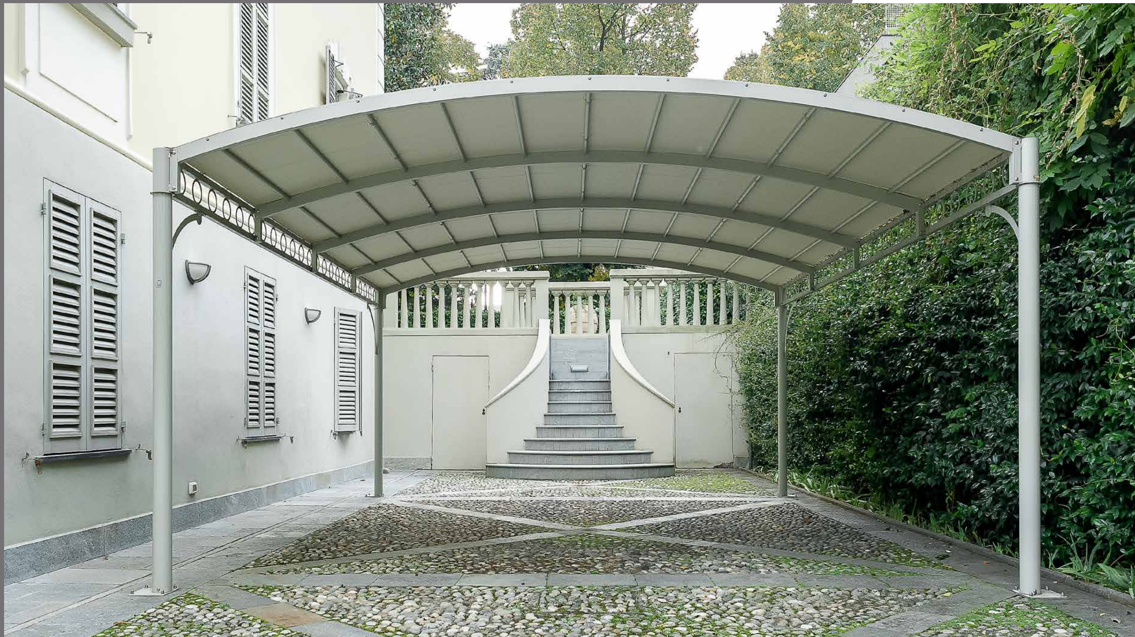
Montanti rotondi a richiesta e trave personalizzato