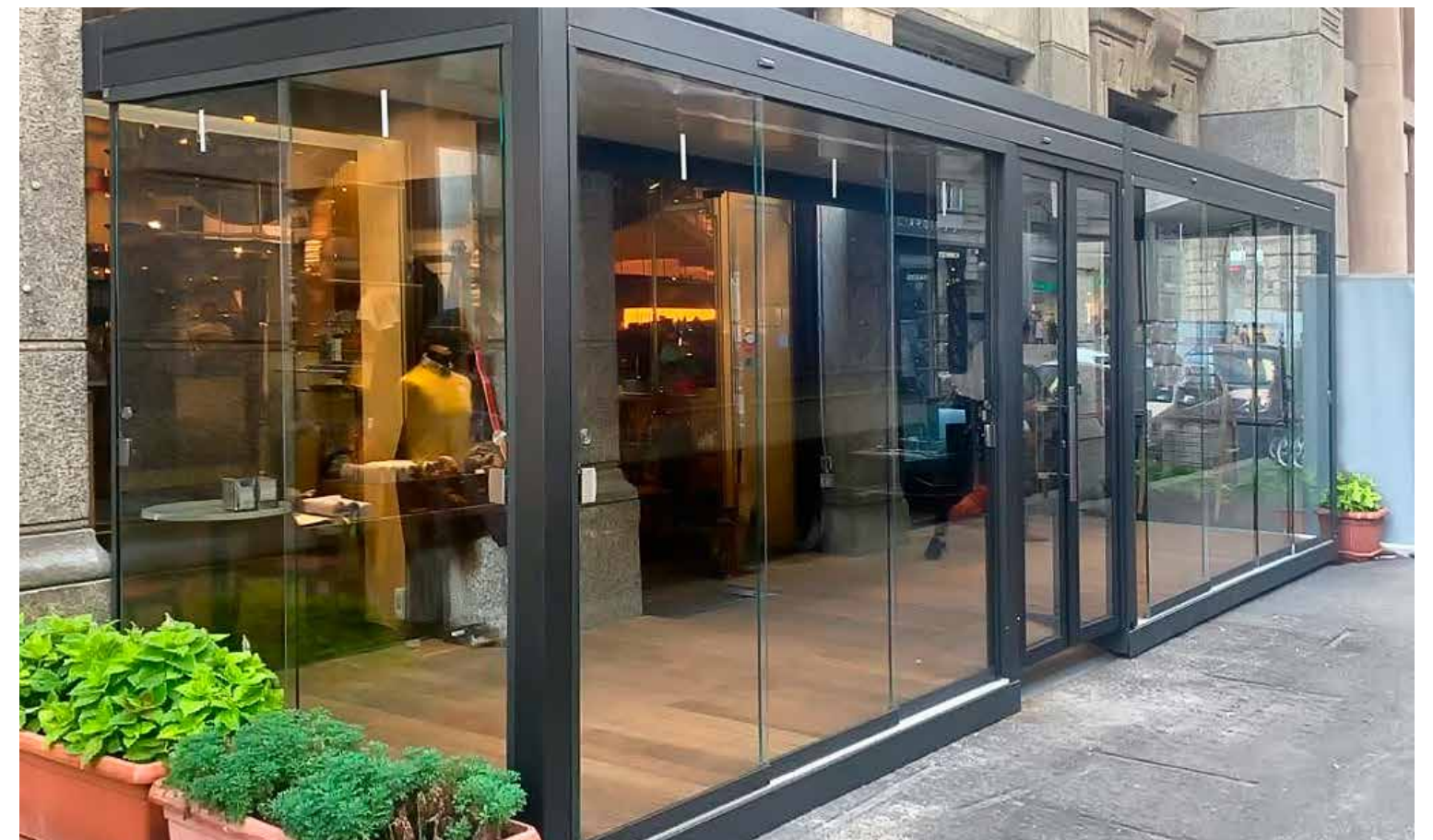
Predisposizione per vetri