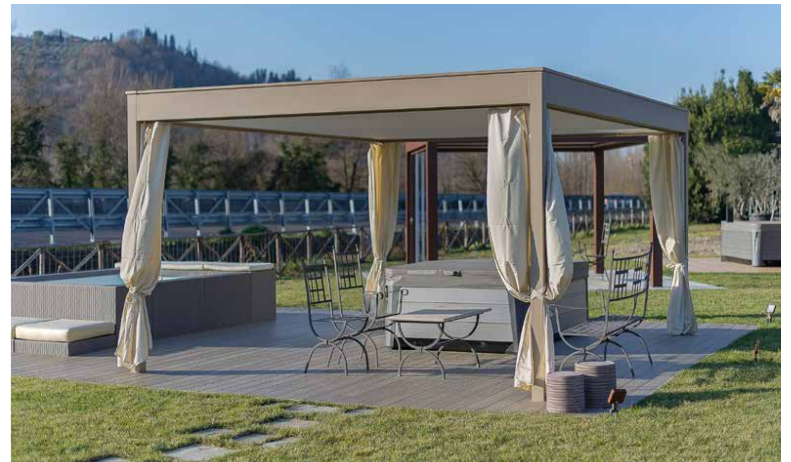
Sottotetto e Copripalo in tessuto