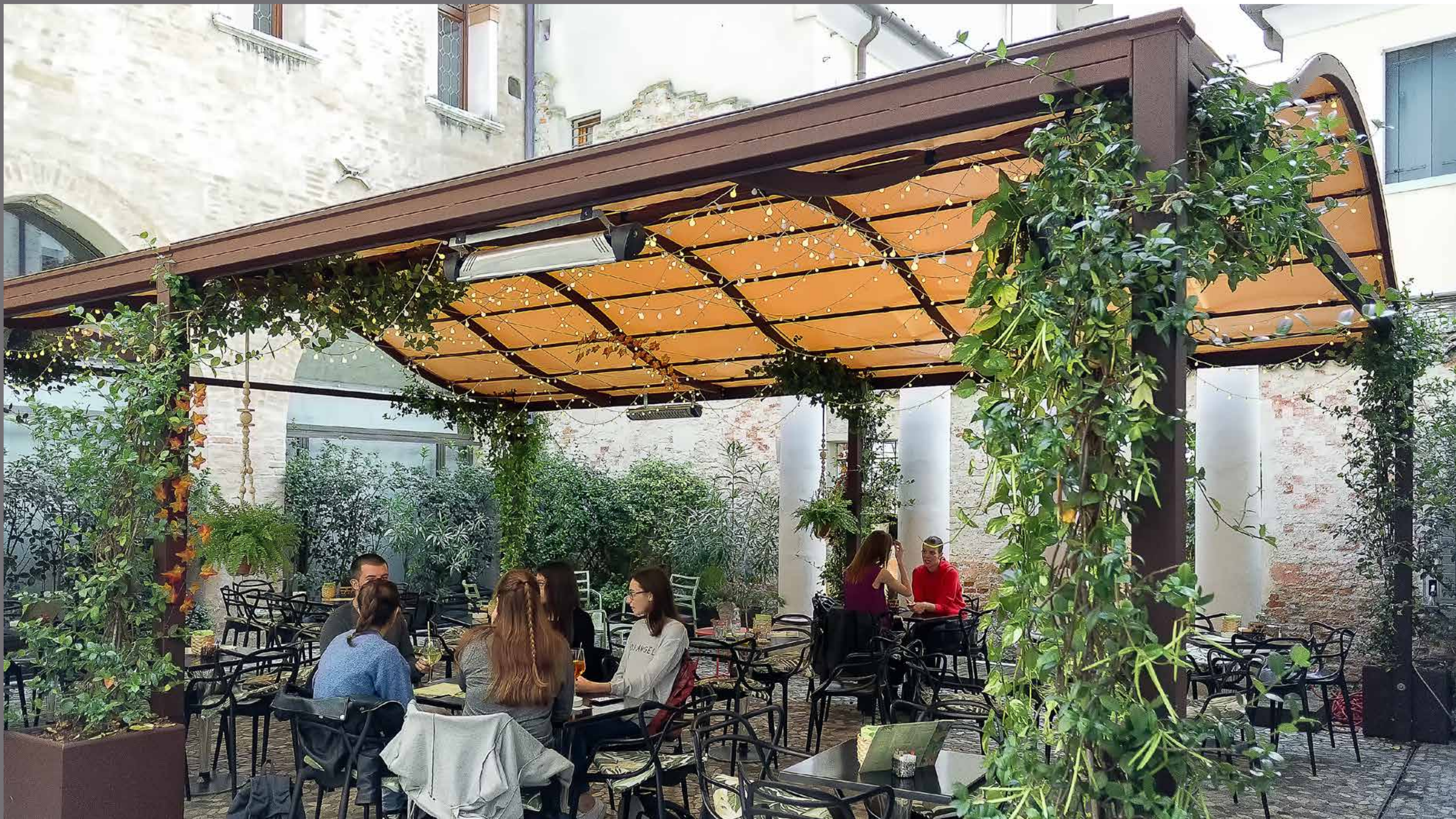
Falda a doppia curva