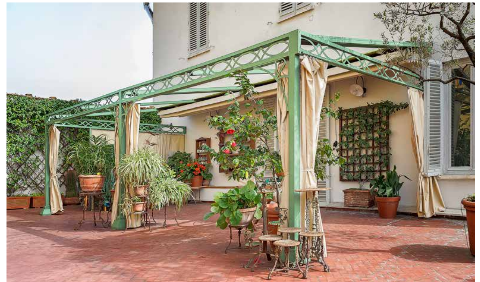
CLASSICO Colore 850

Canale raccolta acqua Personalizzazione del decoro trave e accessori Solo apertura manuale