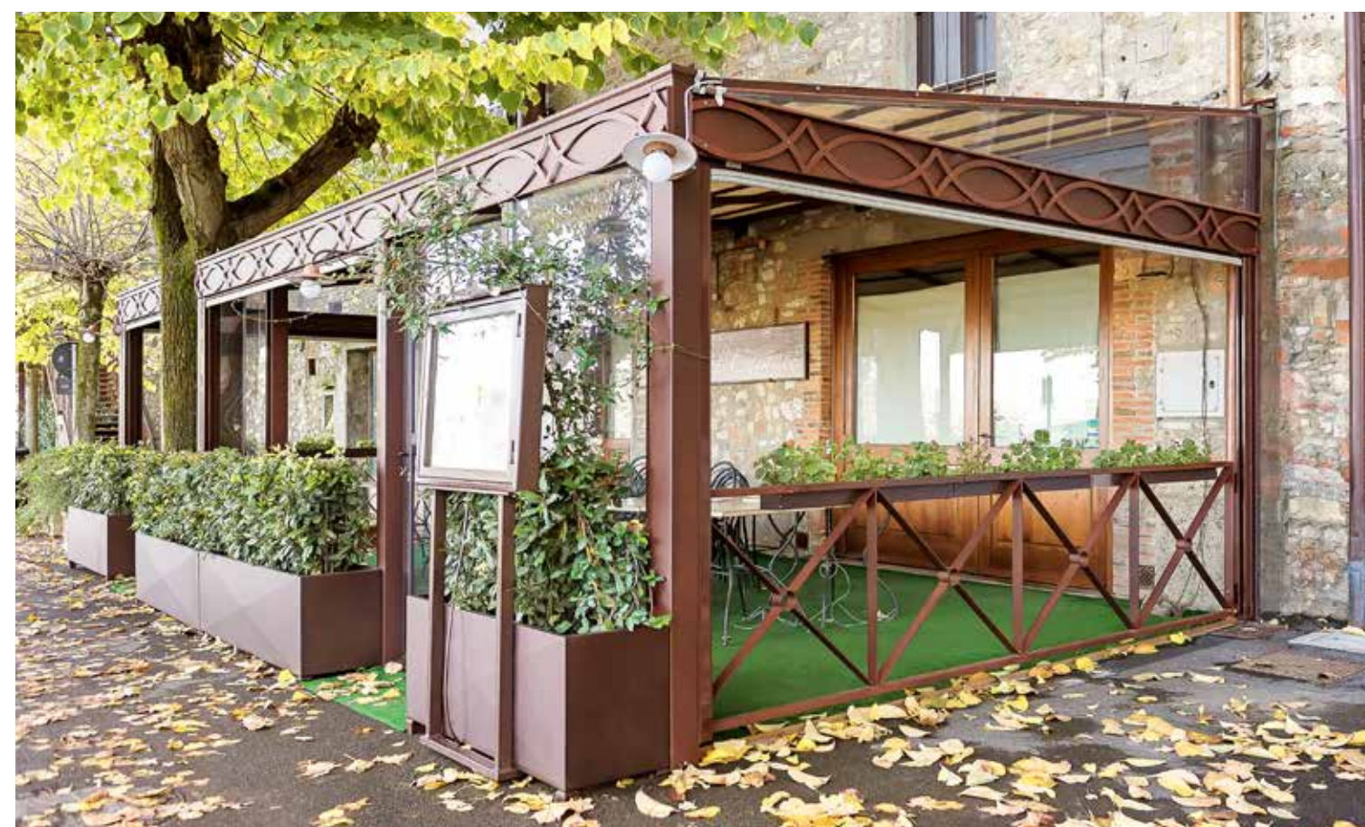
Parapetto e fioriere a disegno