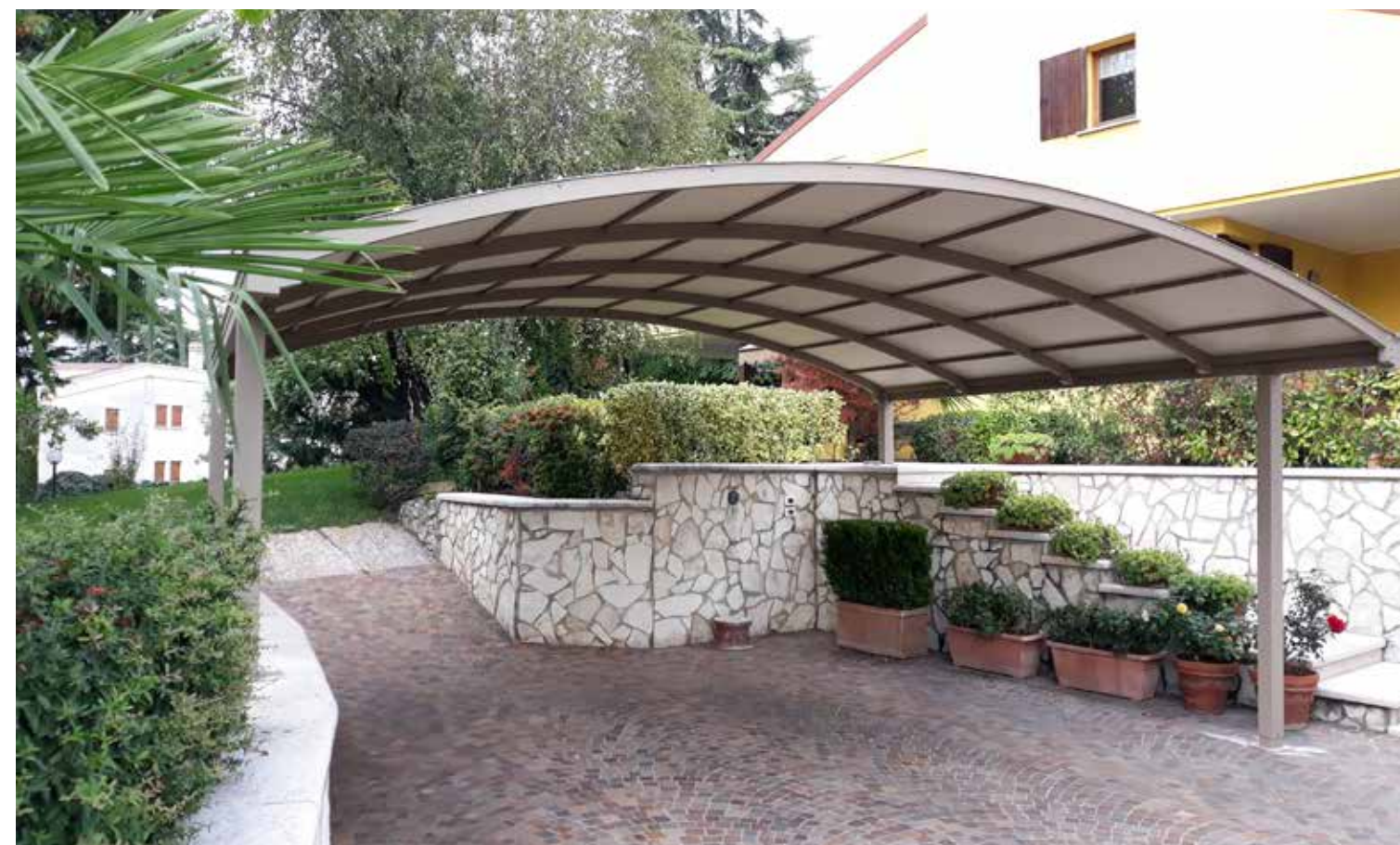
Falda a botte