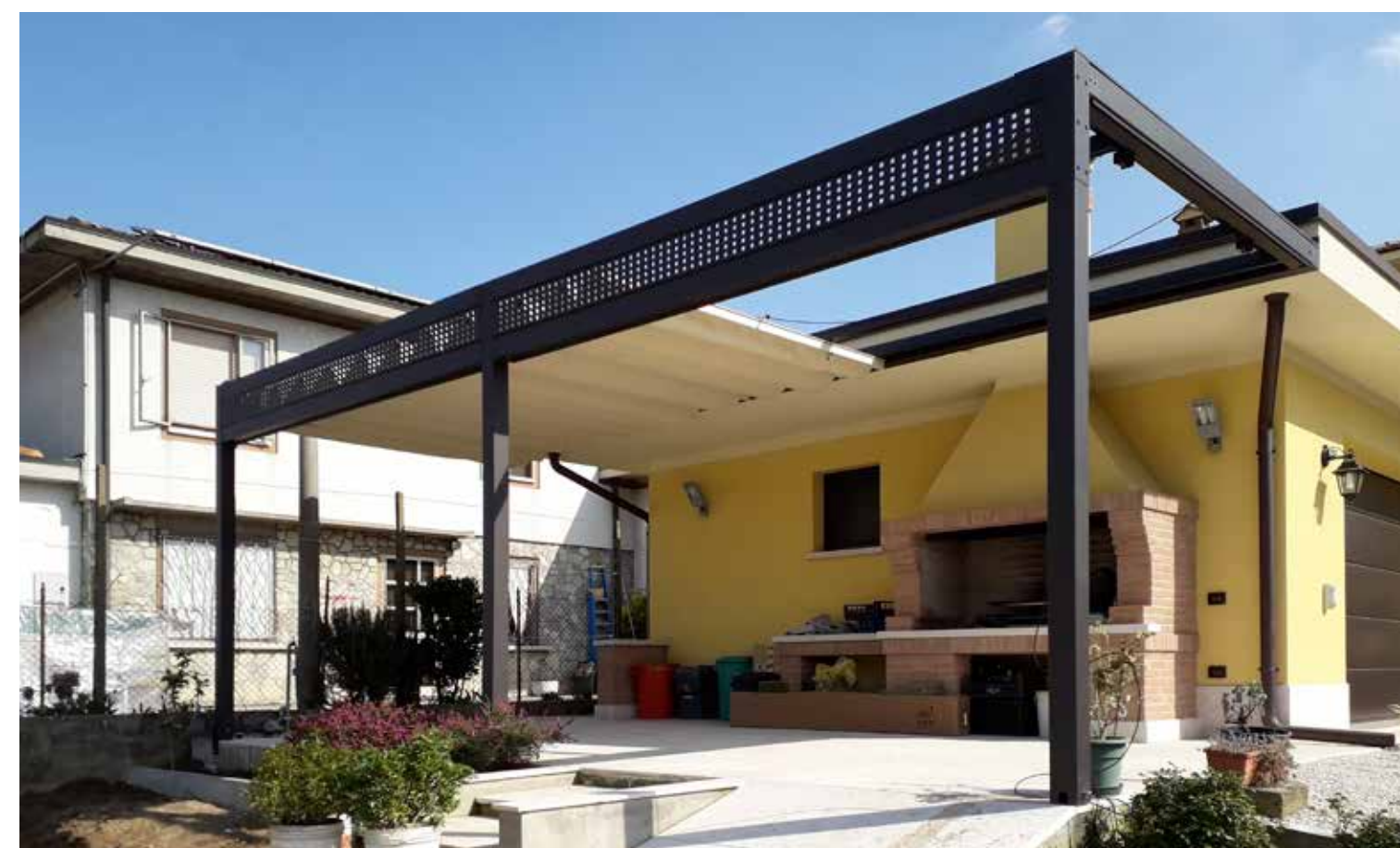
Realizzazione trave su richiesta del cliente