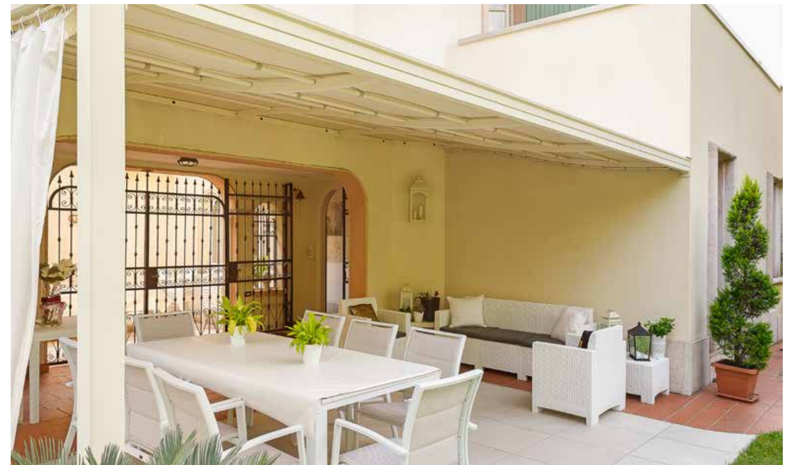
Fissaggio trave a muro

Canale raccolta acqua Possibile predisposizione per vetri o tende avvolgibili