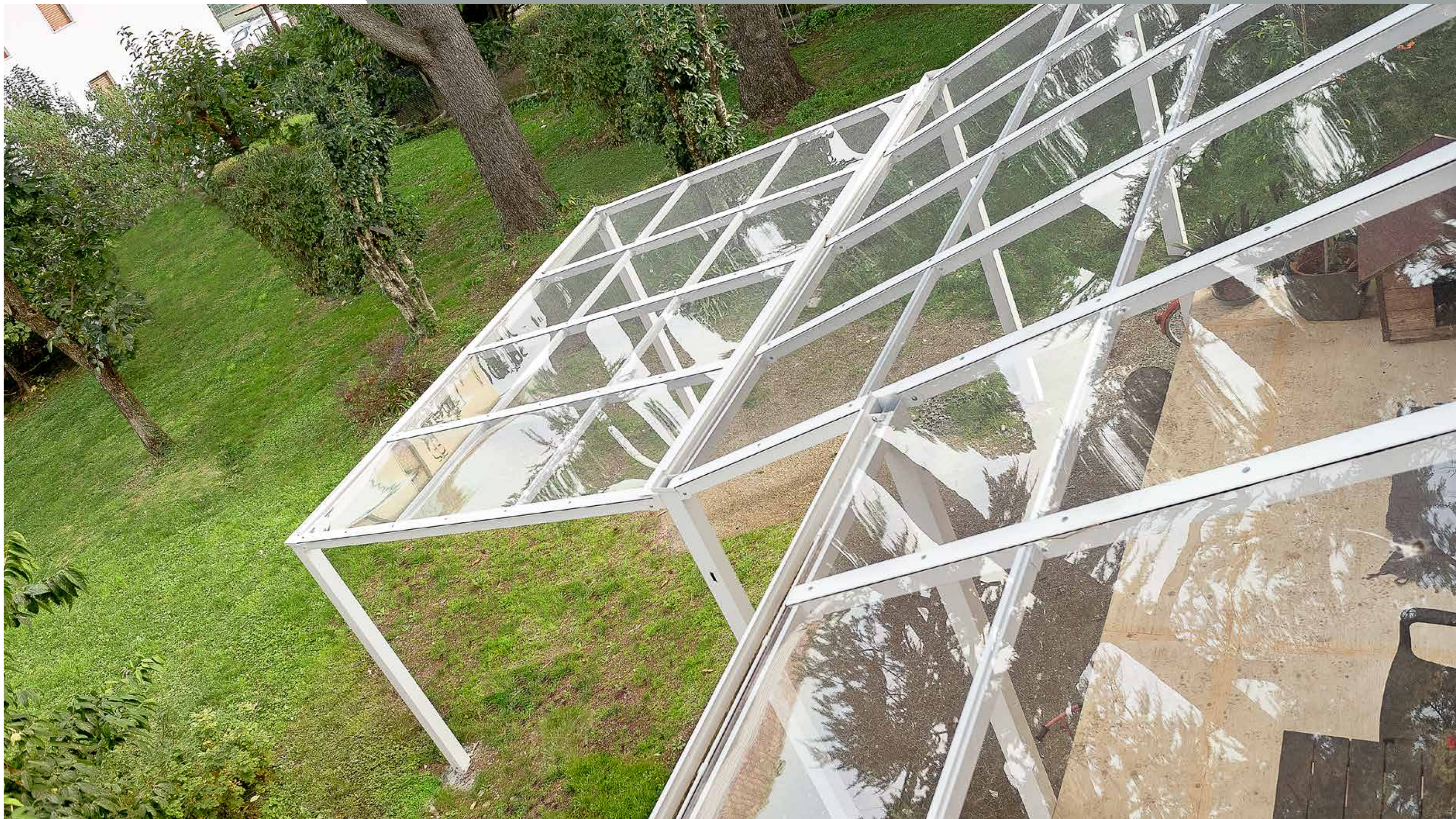
Copertura in Policarbonato