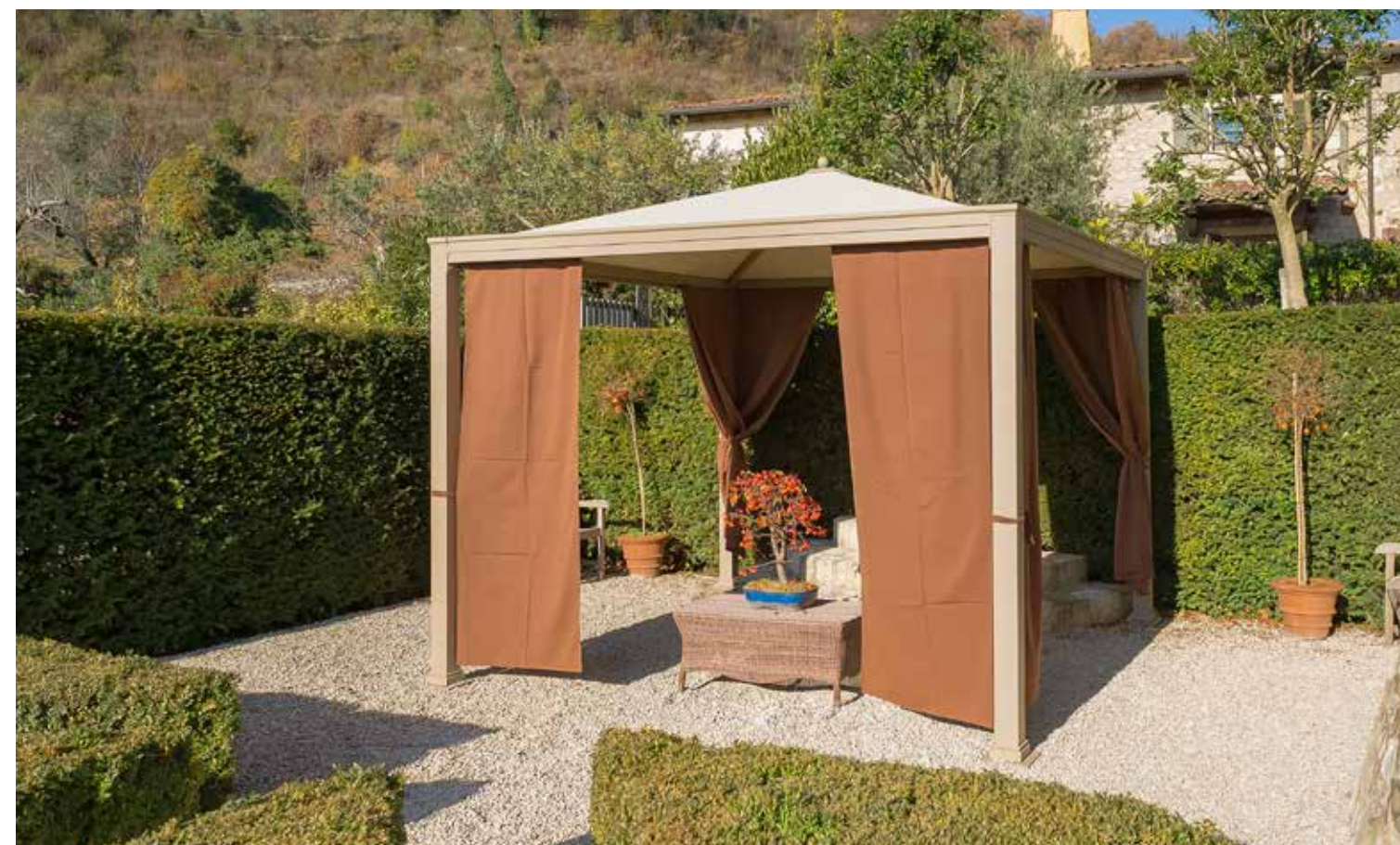
Frangisole in tessuto

Canale raccolta acqua Possibile predisposizione per vetri o tende avvolgibili