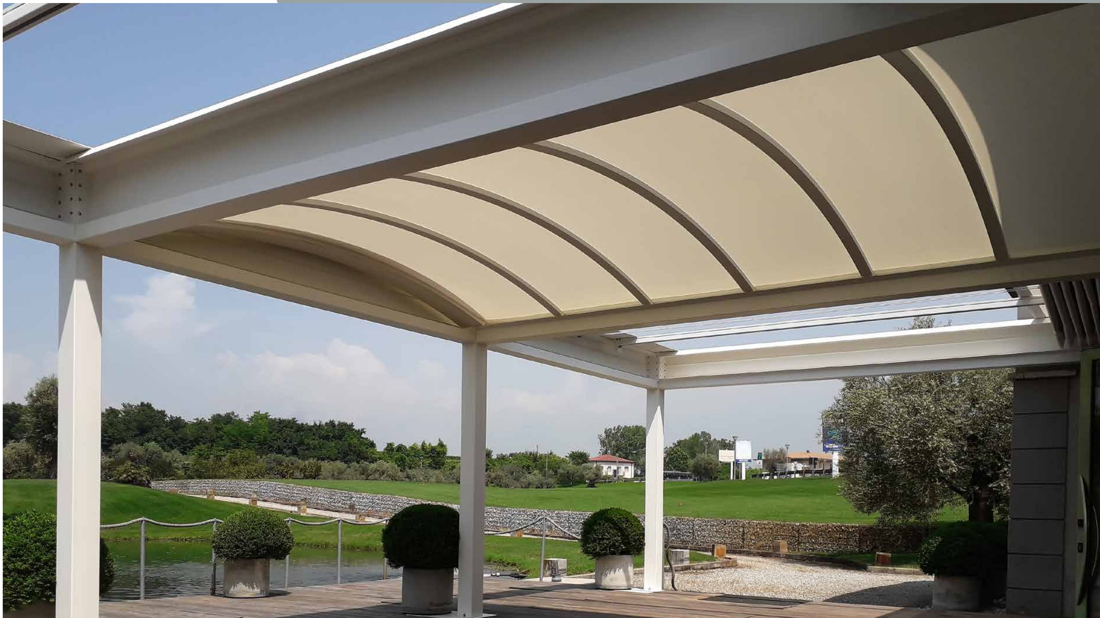
Manuale retraibile con tunnel fisso