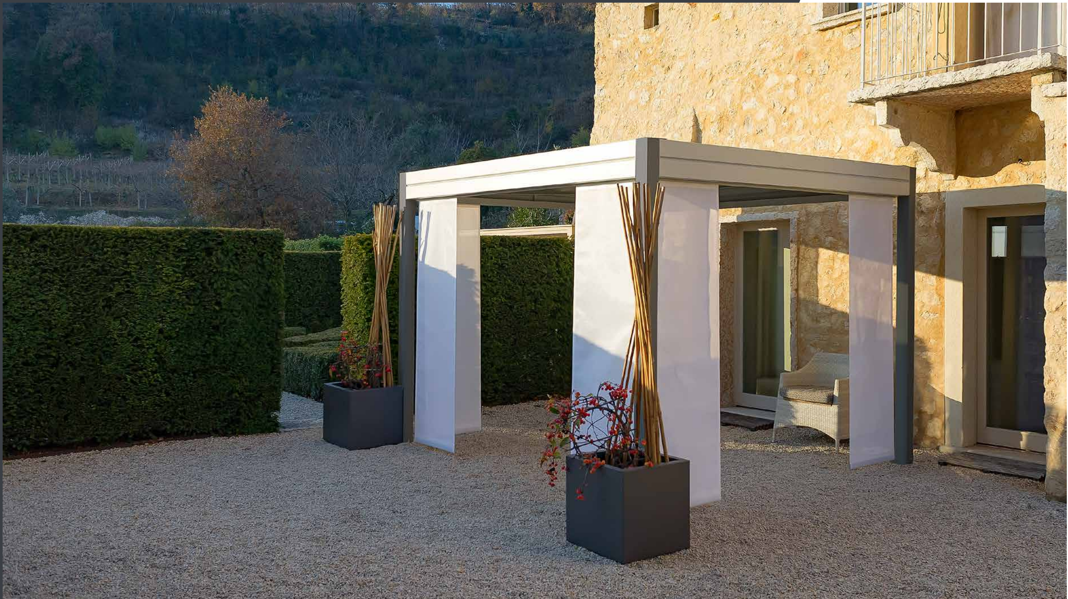
Versione bicolore con tende frangisole