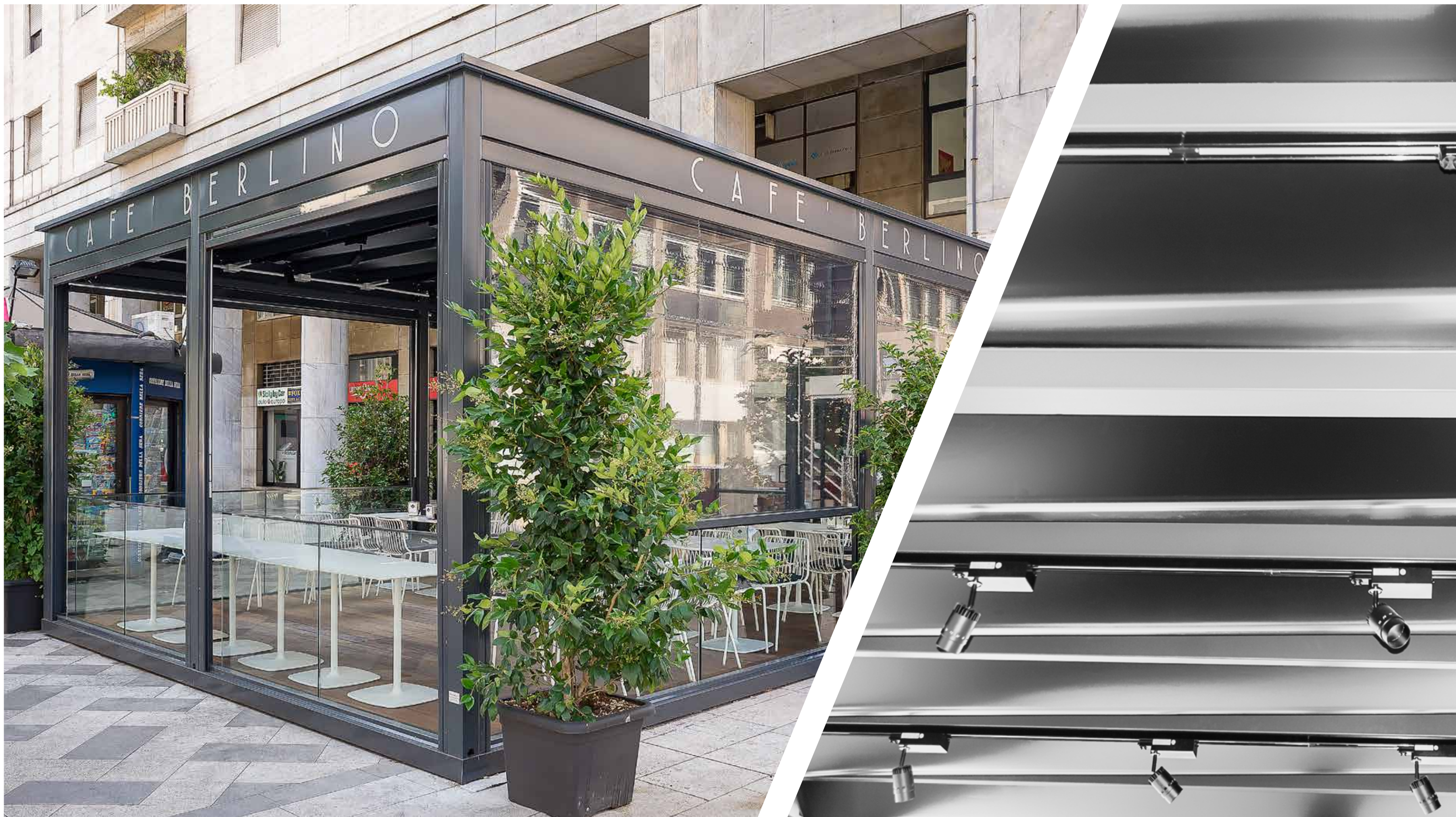
Predisposizione passaggio cavi luce