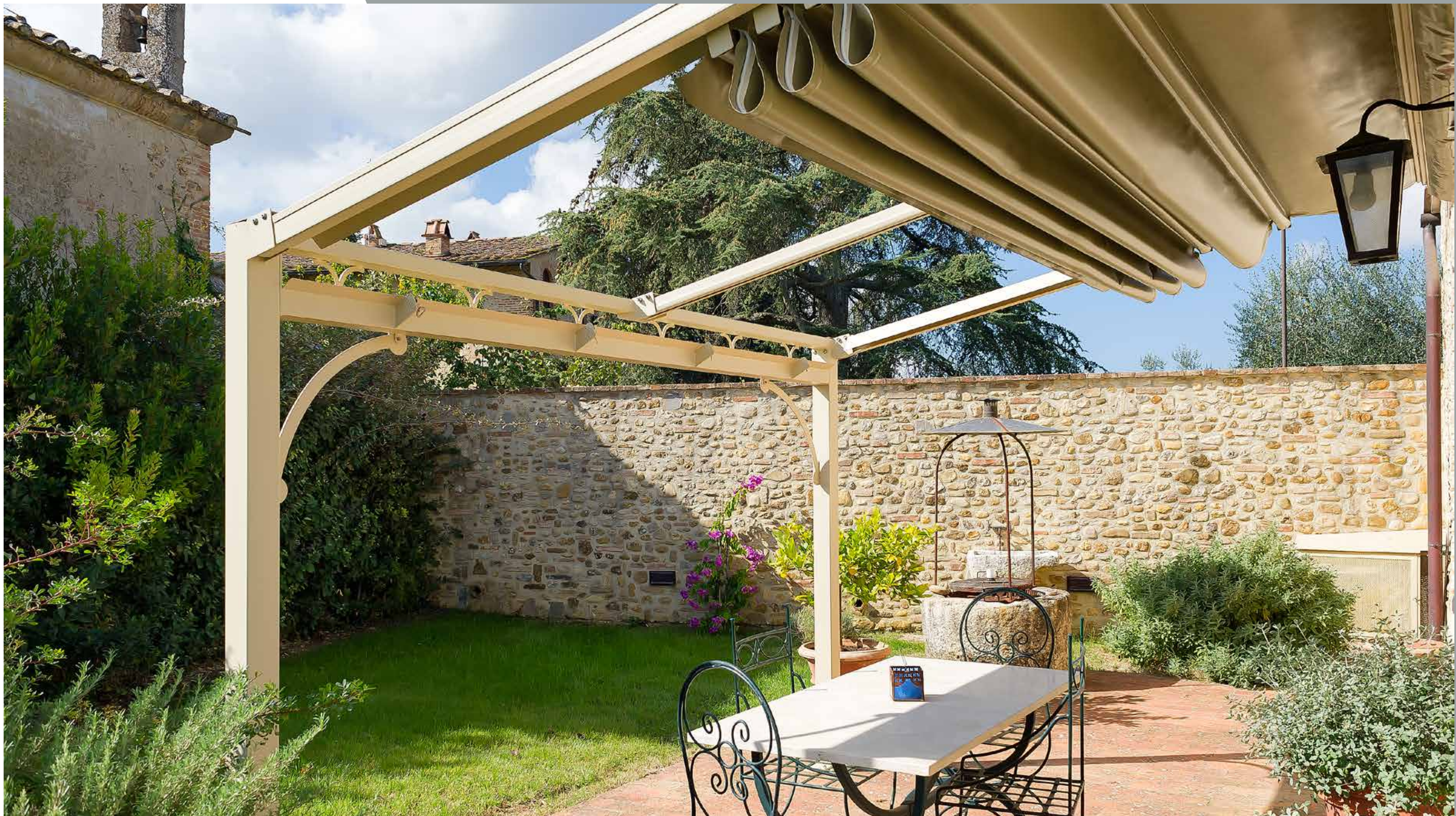
Rompitratta in alluminio verniciato