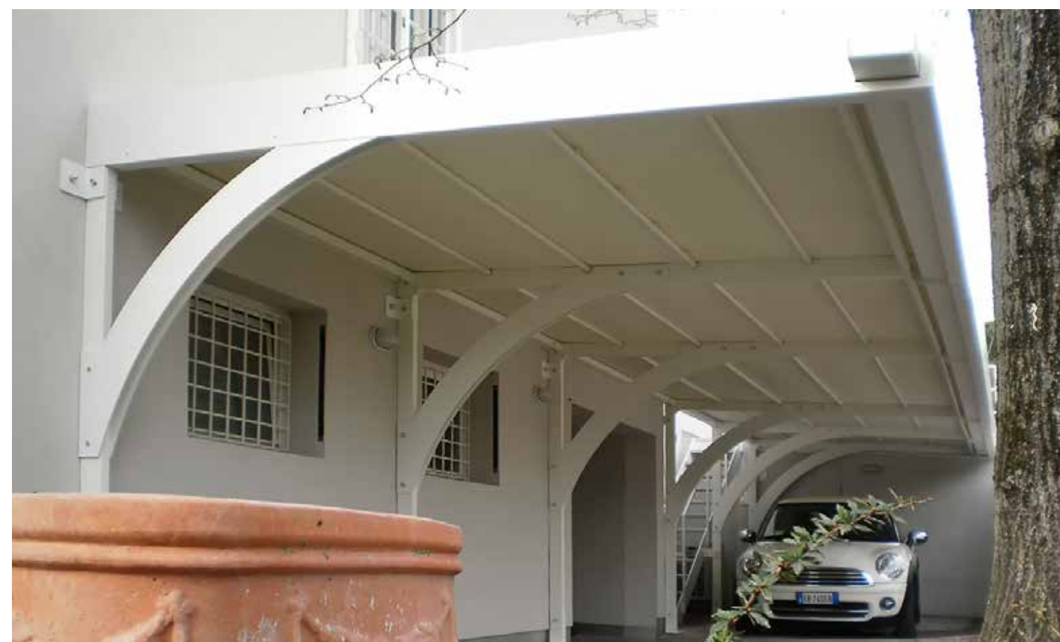
Progetto tettoia falda rovescia