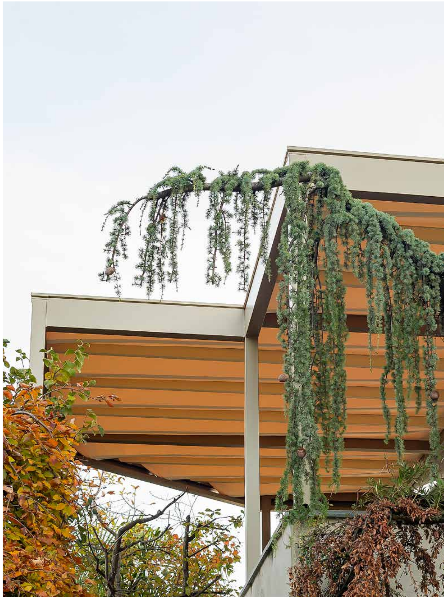
Struttura sagomata personalizzata