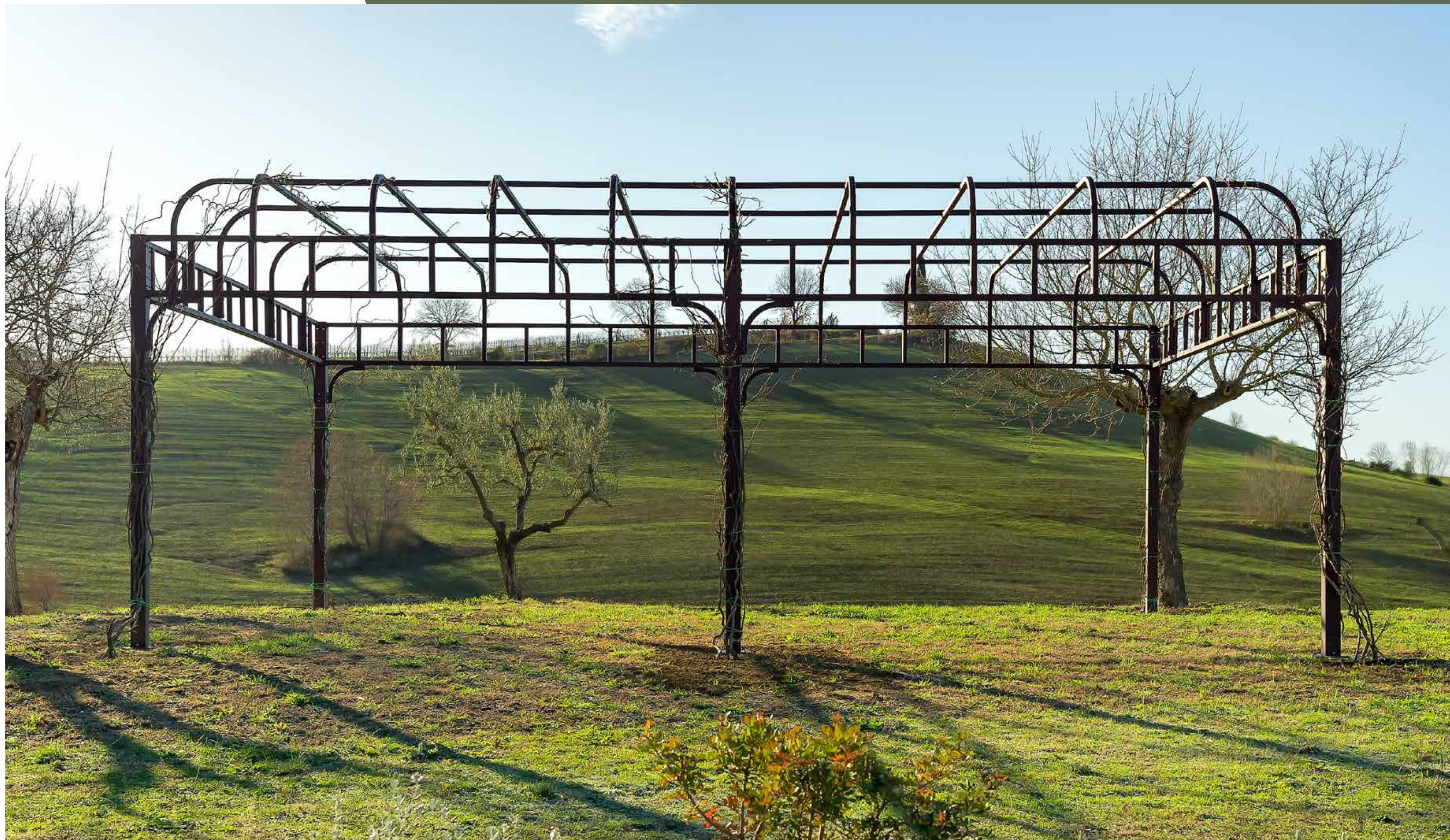
Struttura per rampicante