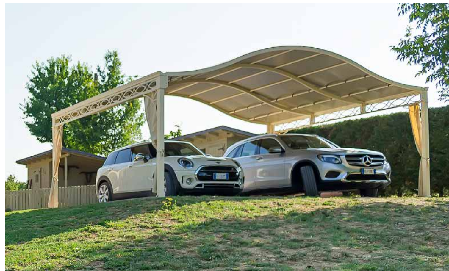
Arcate di grandi dimensioni

Canale raccolta acqua Personalizzazione del decoro trave e accessori