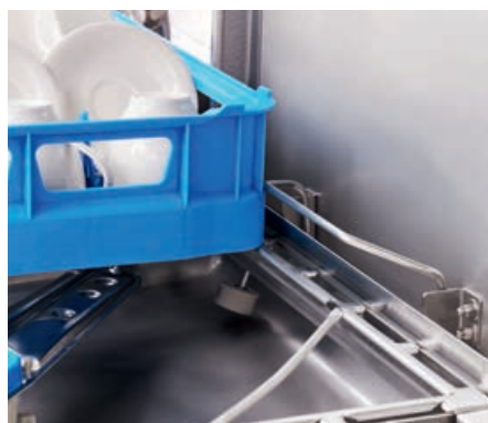
Evita movimenti superflui: il riconoscimento automatico del cesto