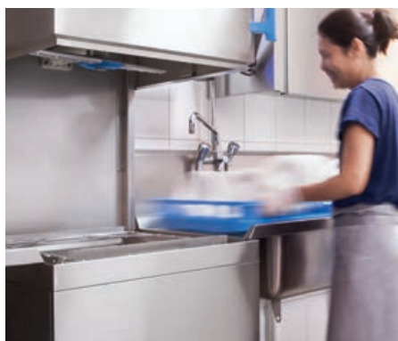
Operazioni di carico e scarico semplici e comode

ma riducono anche i tempi di lavoro. Nell'ambito di un vasto test sul campo i clienti ci hanno confermato un risparmio di tempo di ca. 30 minuti per ogni giornata di lavaggio (con ca. 120 lavaggi per ogni turno di lavoro).