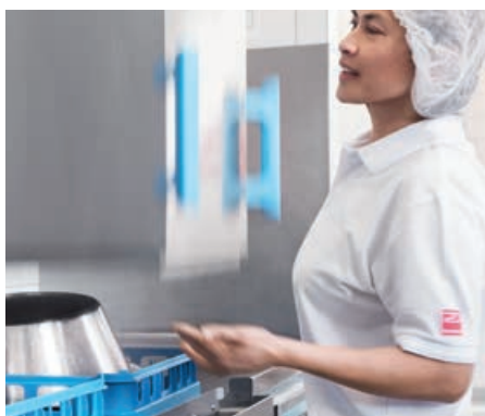
Con un leggero tocco la capote si apre e chiude in modalità di funzionamento manuale